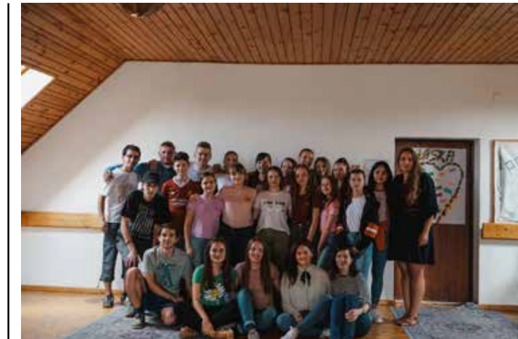
Voice - účastníci